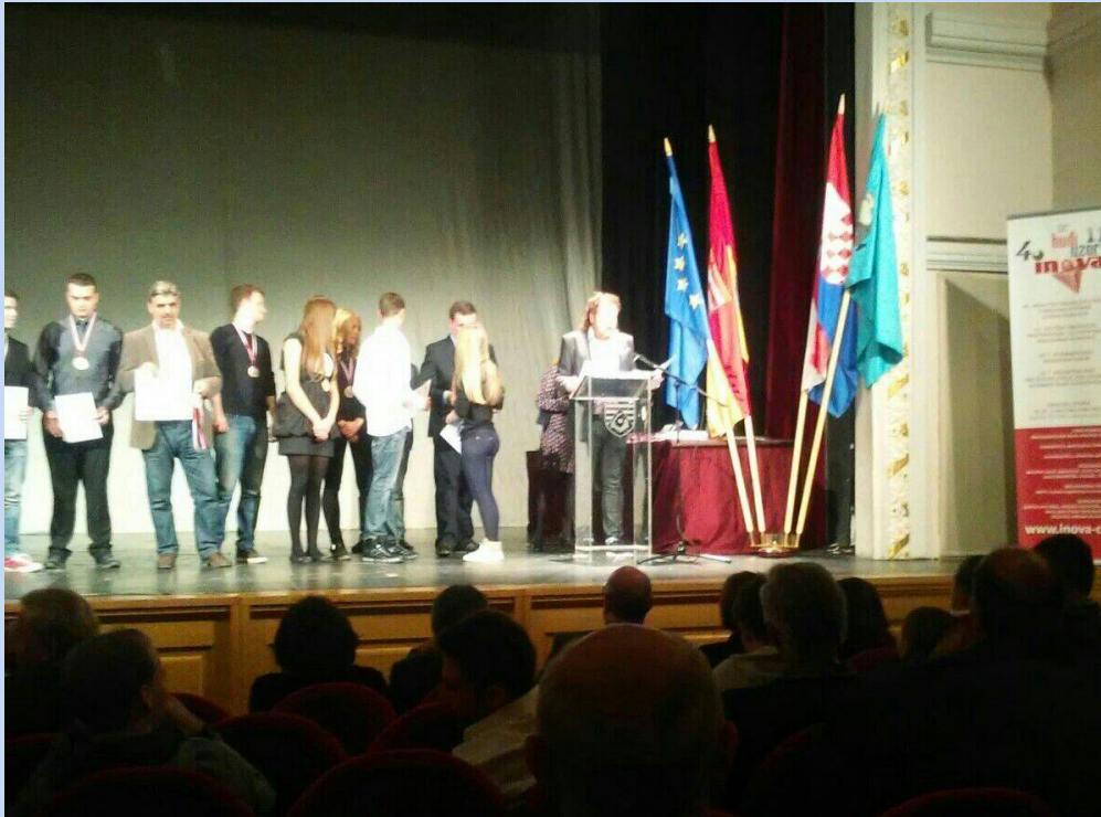
Evita preuzima srebrno odličje na svečanosti Noć stvaralaštva

Nije najvažnije, ali veseli biti uspješan na natjecanjima