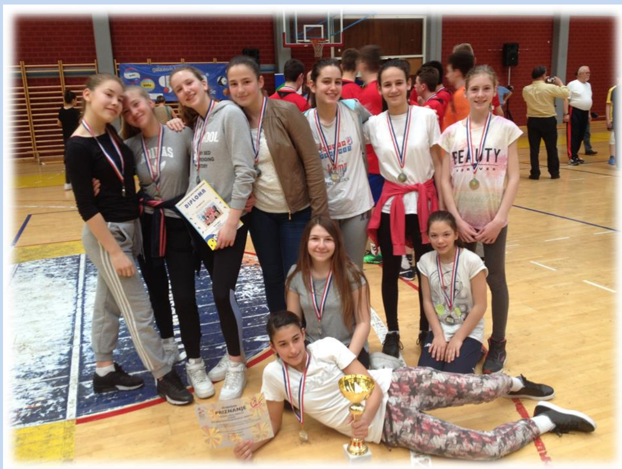
Viceprvačkinje grada Zagreba

Na završnici Prvenstva osnovnih škola grada Zagreba održanoj 6. 4. 2016. u SC Dubrava naše rukometašice osvojile su srebrnu medalju.