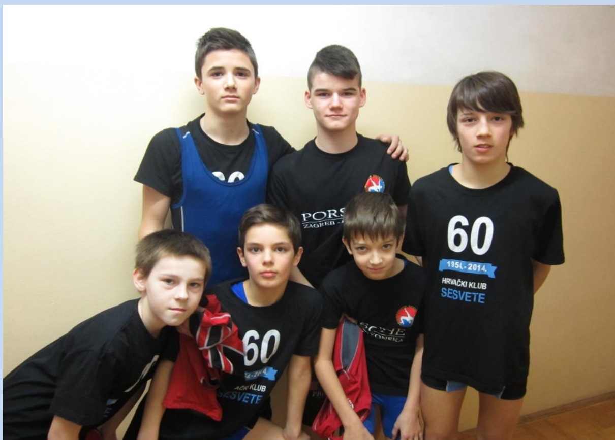
Hrabri, ustrajni i uspješni hrovači

U drugom polugodištu, naglasak je bio na međurazrednim natjecanjima kao što su razne momčadske igre, orijentacijsko trčanje, ples, pjevanje. Pridružili su im se i učenici iz nekih od susjednih škola sa sesvetskog područja.