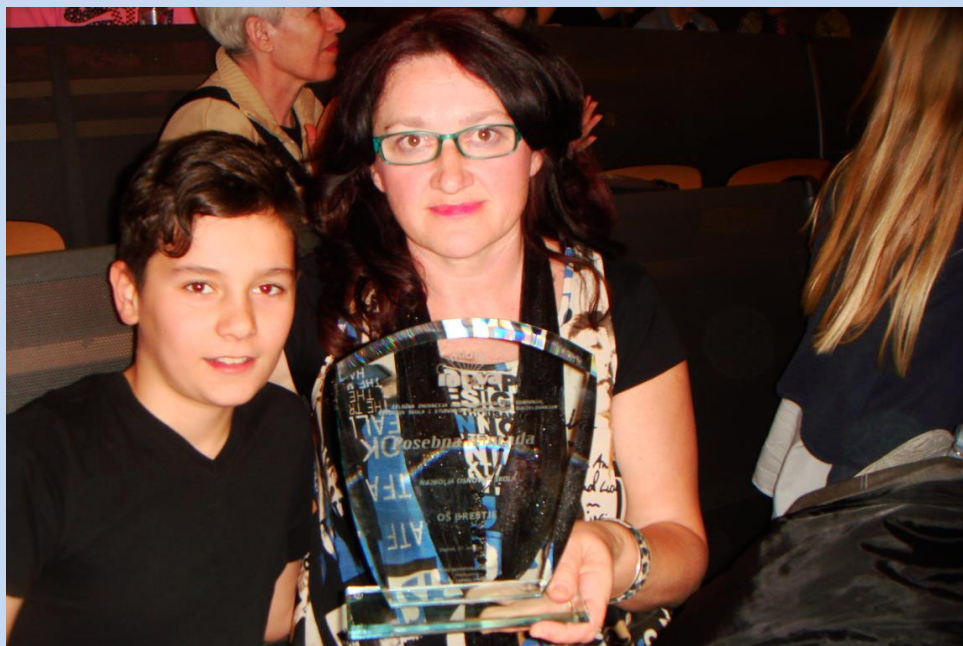
Nagrada za najbolju osnovnu školu

Uz tri zlatne, tri srebrne i četiri brončane medalje, njihov uspjeh i izvrsnost potvrdila je i posebna Nagrada za najbolju osnovnu školu, a Evitin rad je predložen za 9. nacionalnu izložbu ove godine u Kastvu.