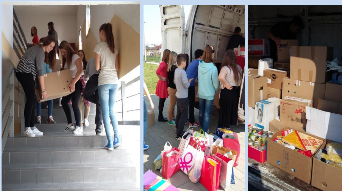
Od škole do odredišta

Učenici su paketima s odjećom i osobnim potrepštinama u vrijeme došašća darivali Caritas za njihovu kuću u Dubcu, te ponovno u velikoj uskrсноj akciji kada su prikupljeni paketi prehrambenih i higijenskih proizvoda bili namijenjeni Caritasu Vukovarskog dekanata.