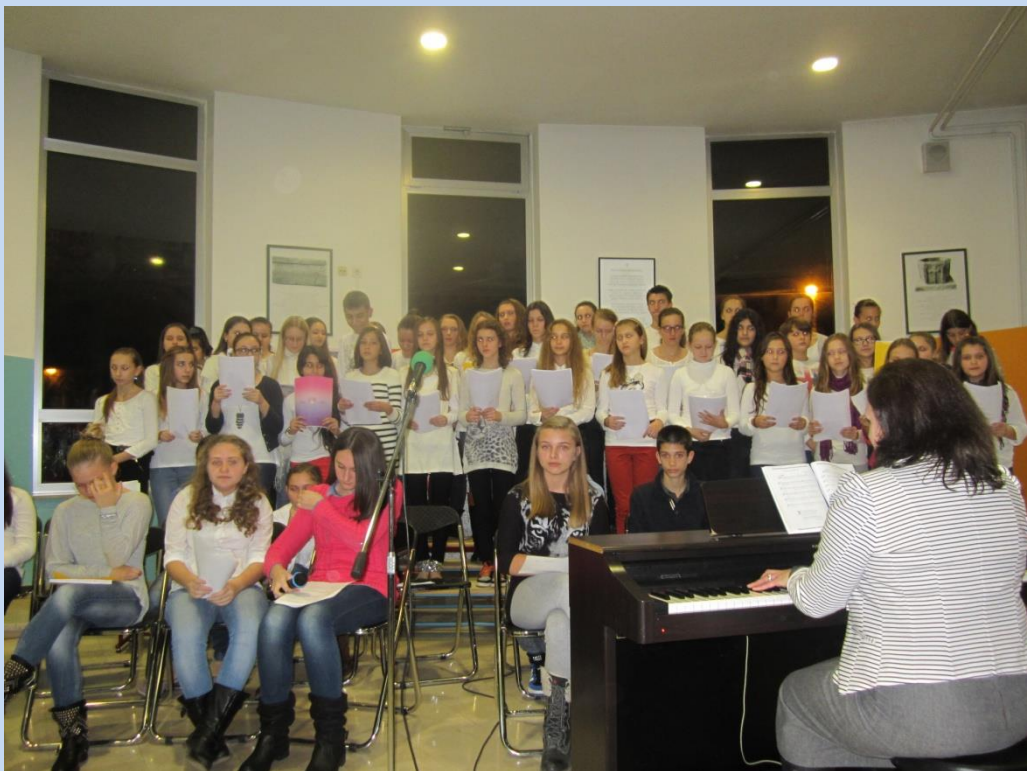
Na kulturnim četvrtcima pjevamo...

Kulturni četvrtak je projekt koji se ove školske godine uspješno provodi već sedmu godinu. Započet je školske godine 2008. /2009., a onda je bio u fazi mirovanja sve do školske godine 2011. /2012. Zamišljen je kao prepoznatljiv oblik javne prezentacije i afirmacije učenika OŠ Brestje. Svim zainteresiranim učenicima, roditeljima i mještanima nastoje se predstaviti brojna postignuća i sadržaji koje nadareni učenici od I. do VIII. razreda marljivo provode u izvannastavnim i izvanškolskim aktivnostima uz sve redovne školske obveze tijekom godine. Odvija se tijekom cijele školske godine zadnjega četvrtka u mjesecu, po završetku poslijepodnevne smjene u 19.10 sati, a svaka večer je tematski obojena.